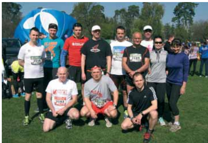
A ladányi futók egy csoportja a Rotary Futófesztiválon