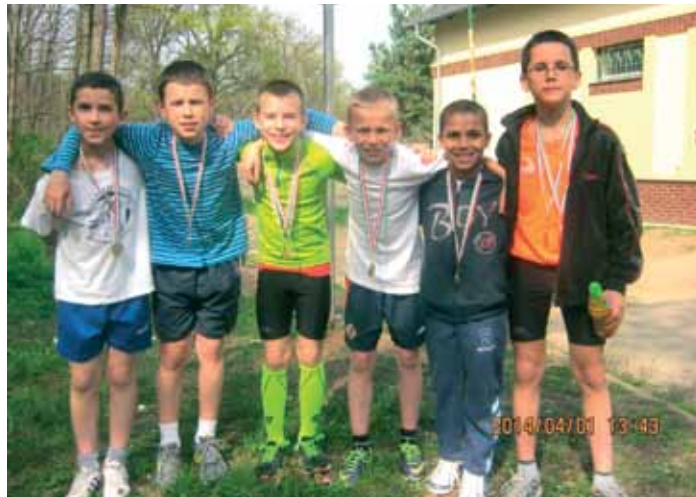
A 3-4. osztályos megyei bajnoksápat