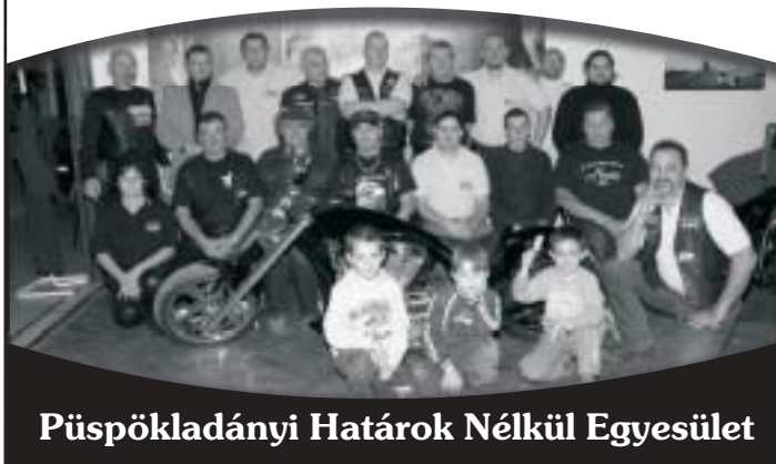
Püspökladányi Határok Nélkül Egyesület

Kaba és Vidéke Takarékszövetkezet Püspökladány, Gagarin u. 1.sz.