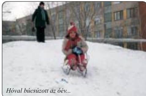
Hóval búcsúzott az óév...