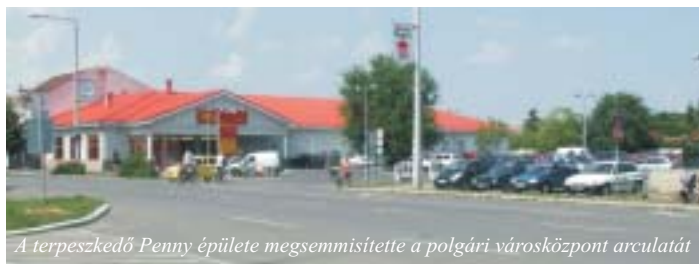
A terpeszkedő Penny épülete megsemmisítette a polgári városközpont arculatát

Három nagy beruházás volt a ciklusban: a Széchenyi - terv pályázatából épített gyógy-centrum áthúzódo befejezése, a petritelapi szennyvíz-hálózat kiépítése és a városközpont rehabilitációja.