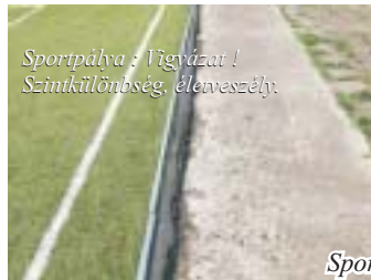
Sportpálya / Víznyázai! Szintkülönbség, éleveszély!