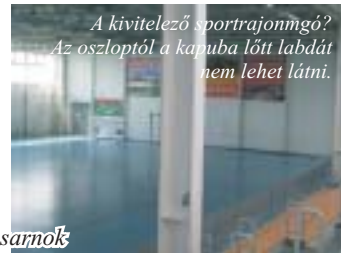
A kivitelező sportrajongó? Az oszloptól a kapuba lőtt labdát nem lehet látni.